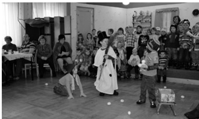
Januar – Schneemann bauen und Schneeballschlacht

Zu Beginn der Adventszeit fanden am 04./05. Dezember 2012 wieder unsere Weihnachtsfeiern für Eltern und Großeltern im Erzgebirgshof Gehringswalde statt. Etwas aufgeregt, jedoch gut vorbereitet präsentierten die Kinder „Die zwölf Monate“. Mit Liedern, Reimen, Gedichten und spielerischen Darbietungen stellten sie das Charakteristische jedes einzelnen Monats vor. Dabei wurde eine Schneeballschlacht und ein Faschingsumzug gezeigt, das Erwachen eines Schneeglöckchens und das wechselhafte Aprilwetter konnten beobachtet werden, im Sommer spazierten die Sonnenkäfer über die Fensterbank und mit dem Lied „Pack die Badehose ein“ ging es an den Badensee, zur Erntezeit wurde die Resi mit dem Traktor abgeholt, Drachen stiegen in den Himmel, der Spannenslange Hansel und die Nudeldicke Dirn pflückten Birnen und im Dezember erklangen Weihnachtslieder. Die Zuschauer waren begeistert und belohnten die Kinder mit kräftigem Applaus. Sogar der Weihnachtsmann schaute am Dienstagnachmittag vorbei und hatte für jeden etwas mitgebracht. Bei anschließendem Kaffee und Kuchen klangen beide Veranstaltungen gemütlich aus.