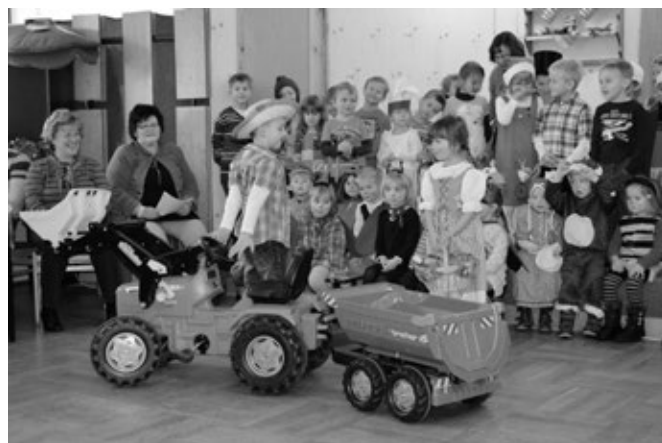
Resi i hol di mit mein Traktor ab

Für die Unterstützung dieser und zahlreicher weiterer Veranstaltungen des vergangenen Jahres bedanken wir uns bei allen Eltern, Helfern, dem Elternrat, der Stadtverwaltung, Firmen und Sponsoren ganz ♥ - lich