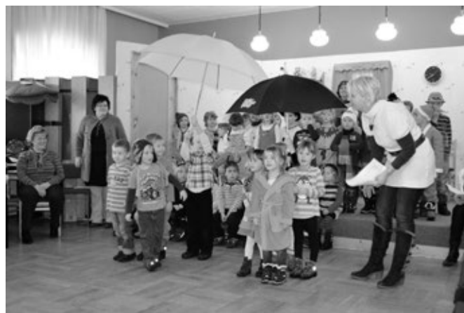
April, April, der weiß nicht, was er will